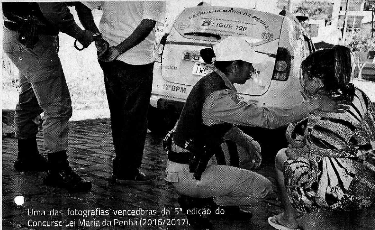
Uma das fotografias vencedoras da 5ª edição do Concurso Lei Maria da Penha (2016/2017).