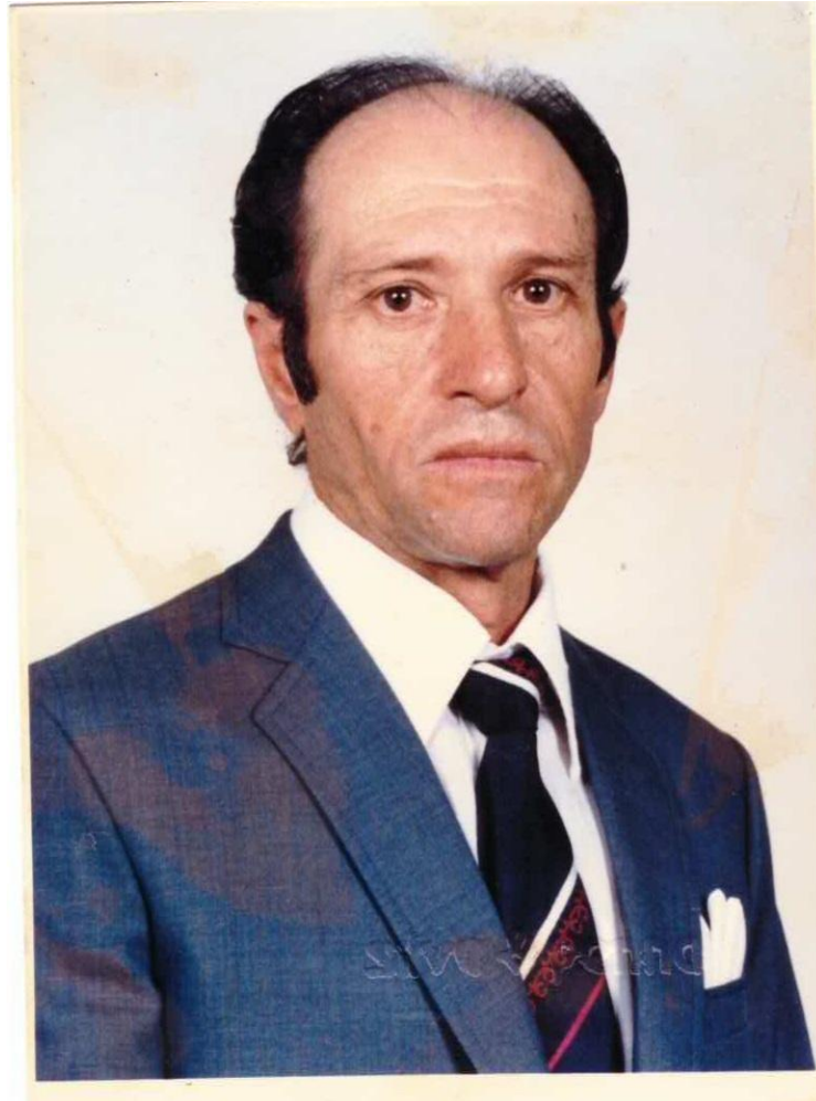
Foto do homenageado enviada pela família