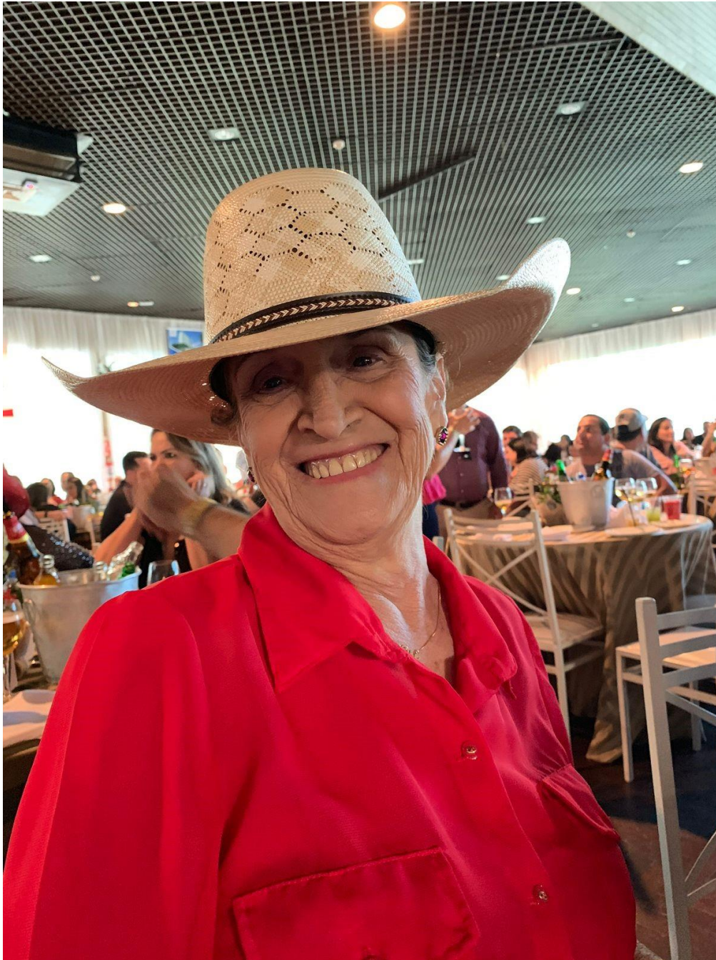
Foto da homenageada enviada pela família