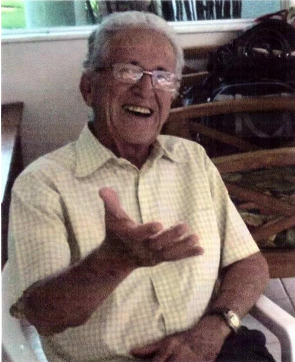
Foto do homenageado enviada pela família