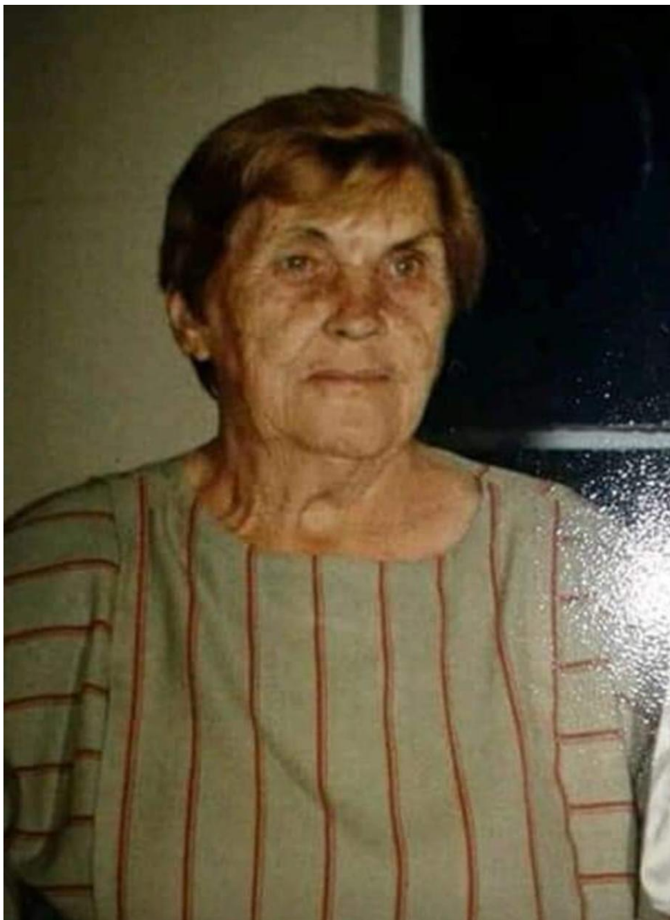
Foto da homenageada enviada pela família