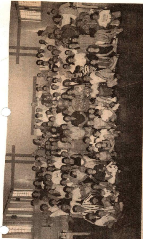
Família Zoppi reunida no salão paroquial, voltou a se reunir 50 anos depois

gostoso e pode ficar como sugestão para que outras famílias, tomem a mesma salutar iniciativa