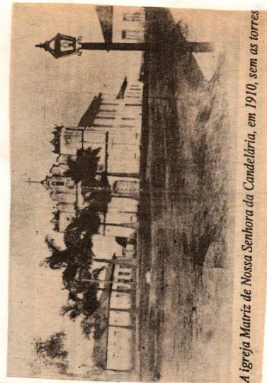
A Igreja Matriz de Nossa Senhora da Candelária, em 1910, sem as torres