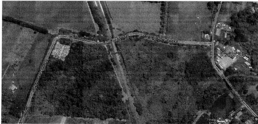
Figura 1 – Trecho Alameda Irmãos Bannwart logo após o cemitério dos suíços, N°889-385.

Vários pedestres e ciclistas se deslocam atualmente, sem nenhuma segurança ao longo da alameda irmãos Bannwart (trecho logo após o cemitério dos suíços N°889-385), muitas vezes tendo que desviar de carros, podendo provocar acidentes com vítimas fatais.