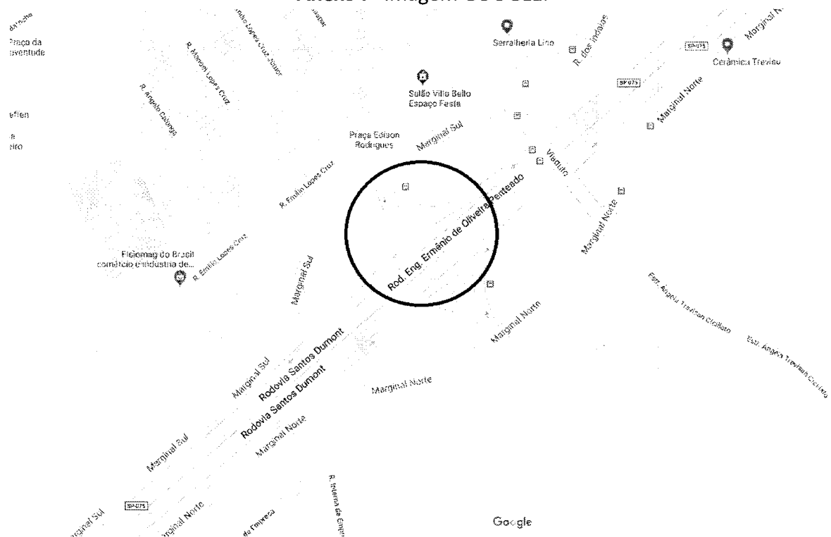
Anexo II - imagem GOOGLE.