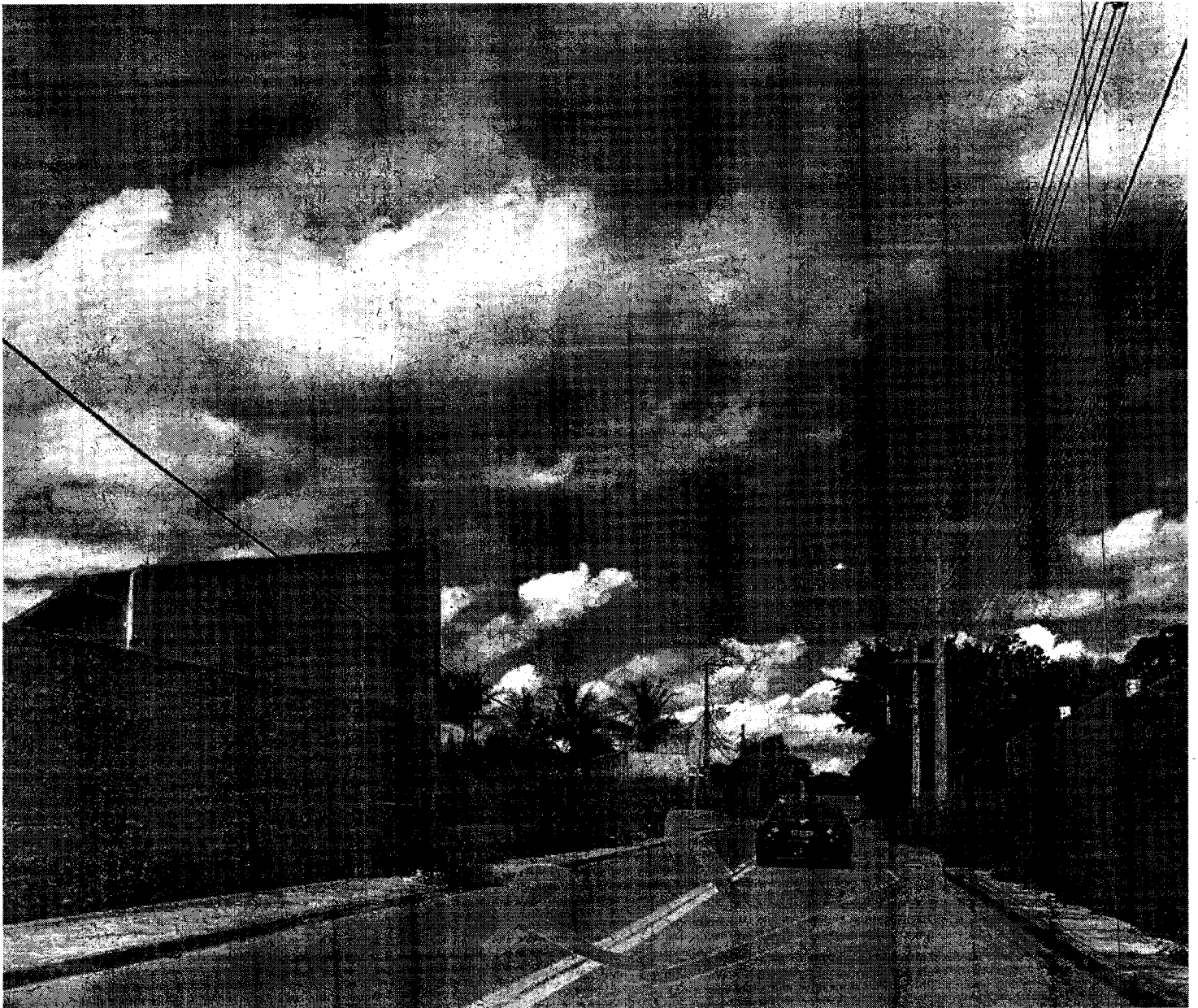
Imagem 12 - Locais com calçadas tomadas pelo mato

Rua Humaitá, 1167 Centro – PABX: (19) 3885-7700. CEP: 13.339-140 – Indaiatuba - SP