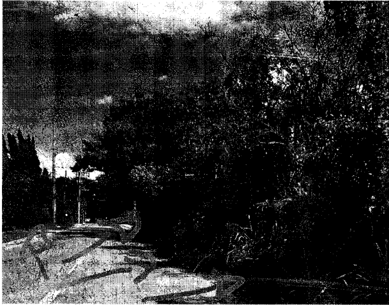
Imagens 3 e 4 - Cercas vivas adentrando a via

Rua Humaitá, 1167 Centro – PABX: (19) 3885-7700. CEP: 13.339-140 – Indaiatuba - SP