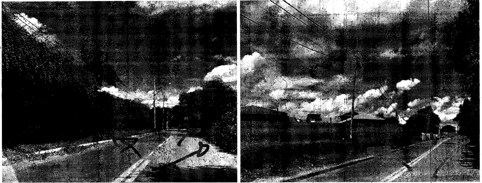
Imagem 8 - Locais com calçadas tomadas pelo mato