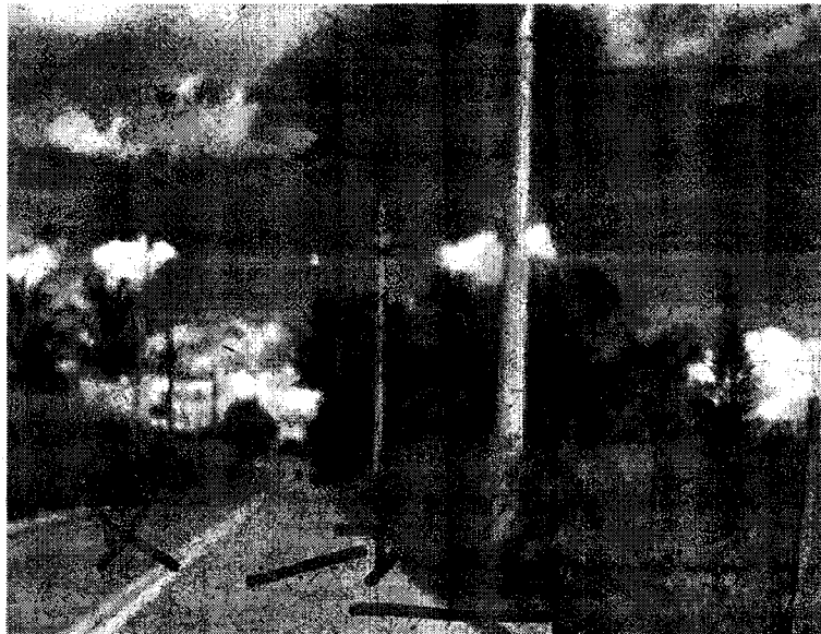
Imagens 9 e 10 - Locais com calçadas tomadas pelo mato

Rua Humaitá, 1167 Centro – PABX: (19) 3885-7700. CEP: 13.339-140 – Indaiatuba - SP