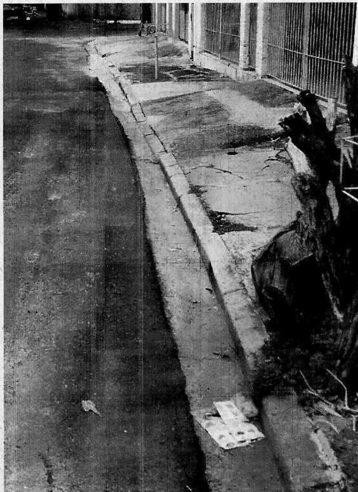
Imagem 1 - Local onde a água fica parada

Rua Humaitá, 1167 Centro – PABX: (19) 3885-7700. CEP: 13.339-140 – Indaiatuba - SP