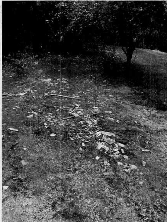
Imagem 12 - Descarte irregular de materiais.