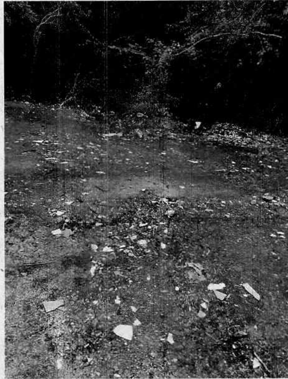
Imagem 8 - Descarte irregular de materiais.