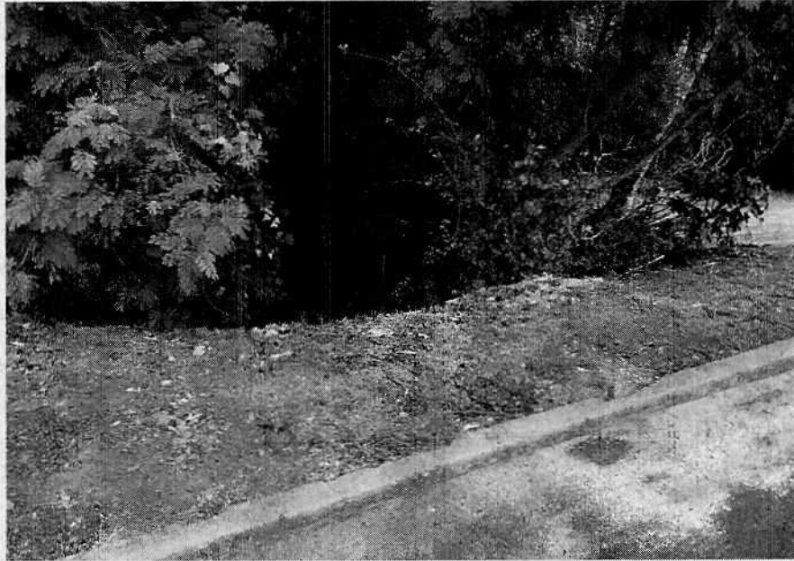
Imagem 2 - “buraco” ao lado da pista de caminhada.

Imagem 1 - distância entre a pista de corrida e o “buraco”, sem proteção e/ou aviso.