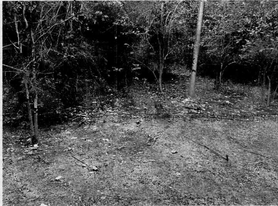
Imagem 14 - Descarte irregular de materiais.