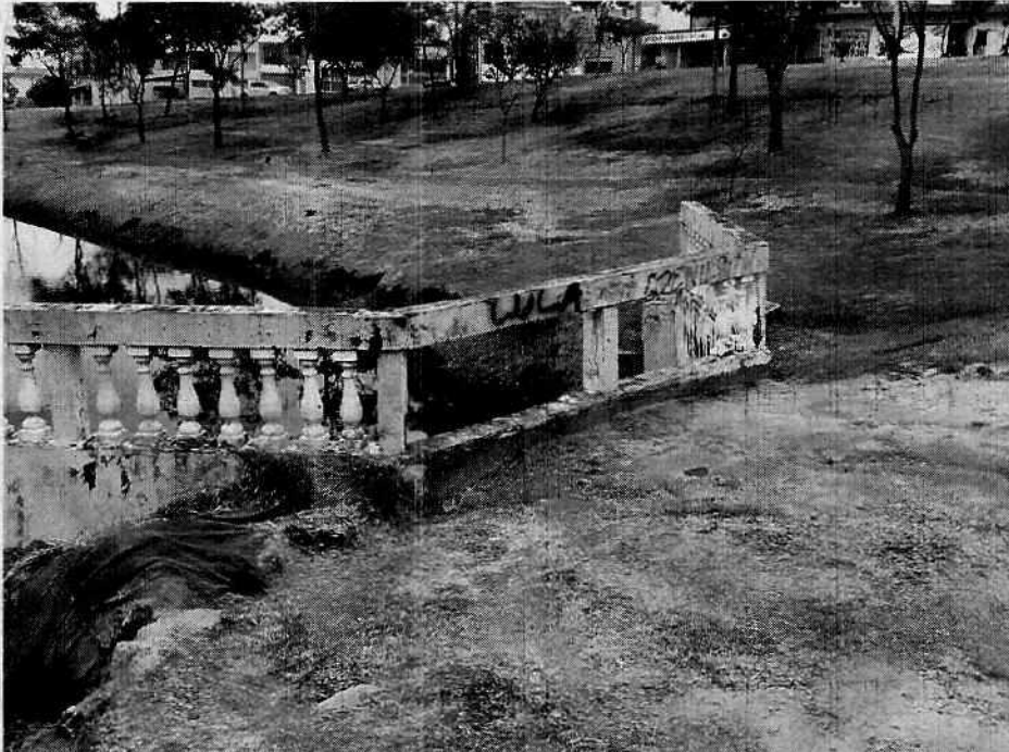
Imagem 18 - Irregularidades na estrutura do calçamento.