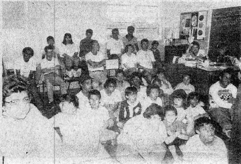
Alunos da Apae assistem filme infantil a cada 15 dias

A manutenção financeira da Apae é feita por meios de verbas recebidas dos órgãos Federal, Estadual e Municipal além de eventos promocionais promovidos pela diretoria e contribuições da comunidade e associados. A partir da segunda quinzena de novembro, como é feito anualmente, a Apae inicia a venda de cartões de natal, trabalho feito pelos próprios estudantes.