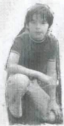
Milton e o