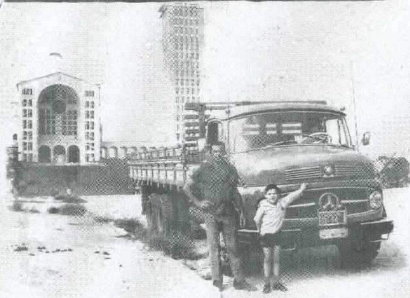
A paradiela do Norte: Milton e o filhote