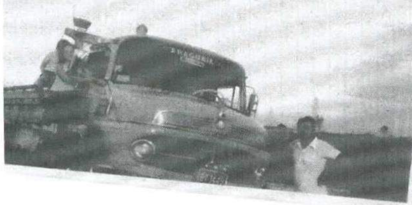
si amava lo Milton