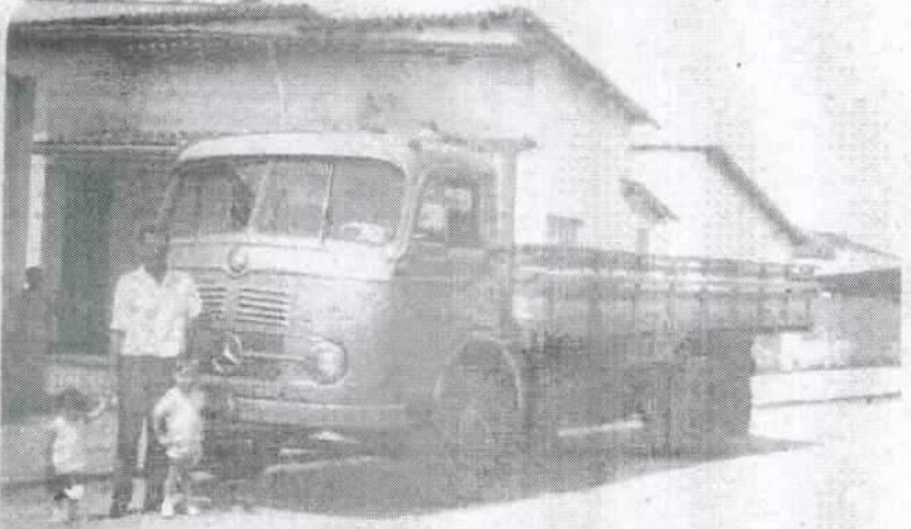
Milton e o filhote