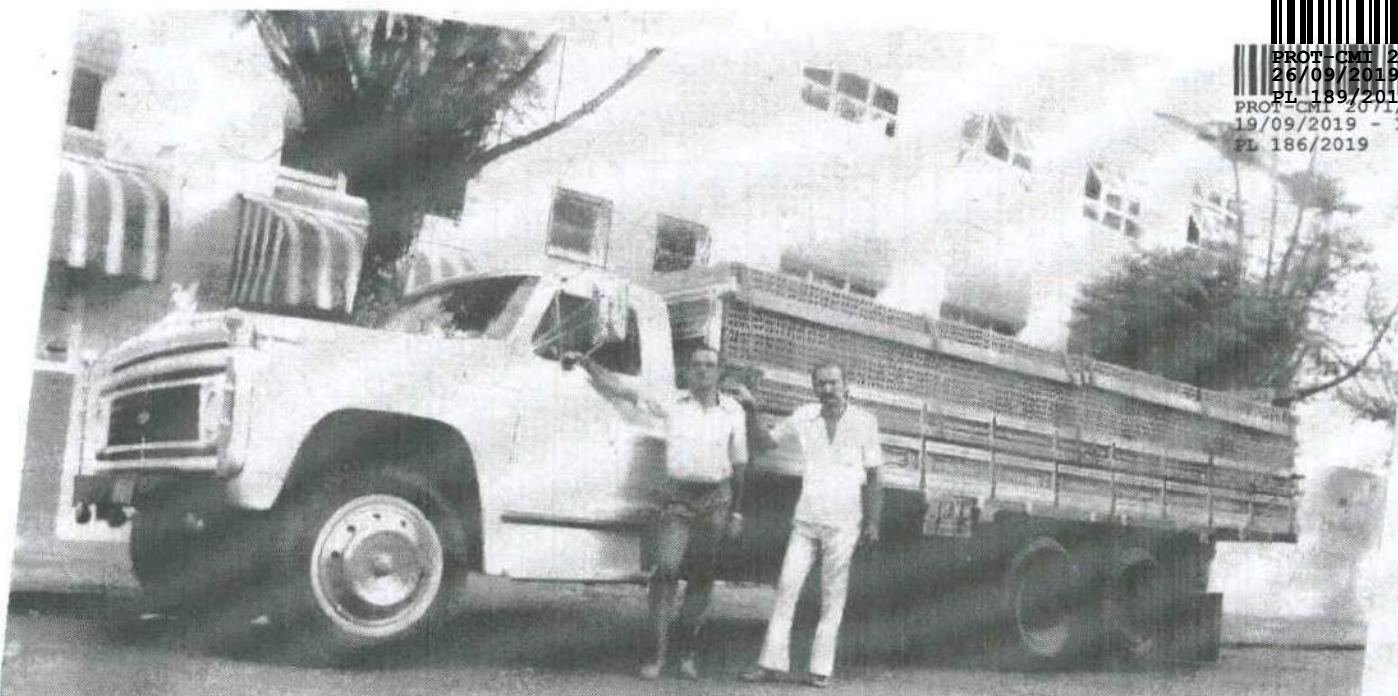
em franca de 30 anos de Comintronics - 30 de Nov 85 Lillem e Roberto Smaatto