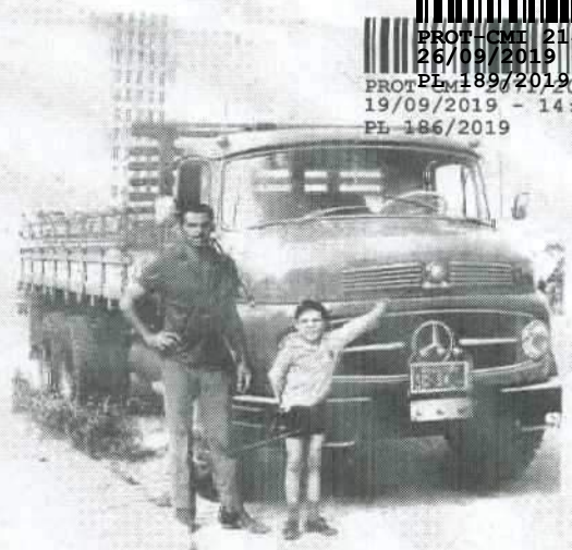
A paradiela Norte Mi (Pao Mi P)