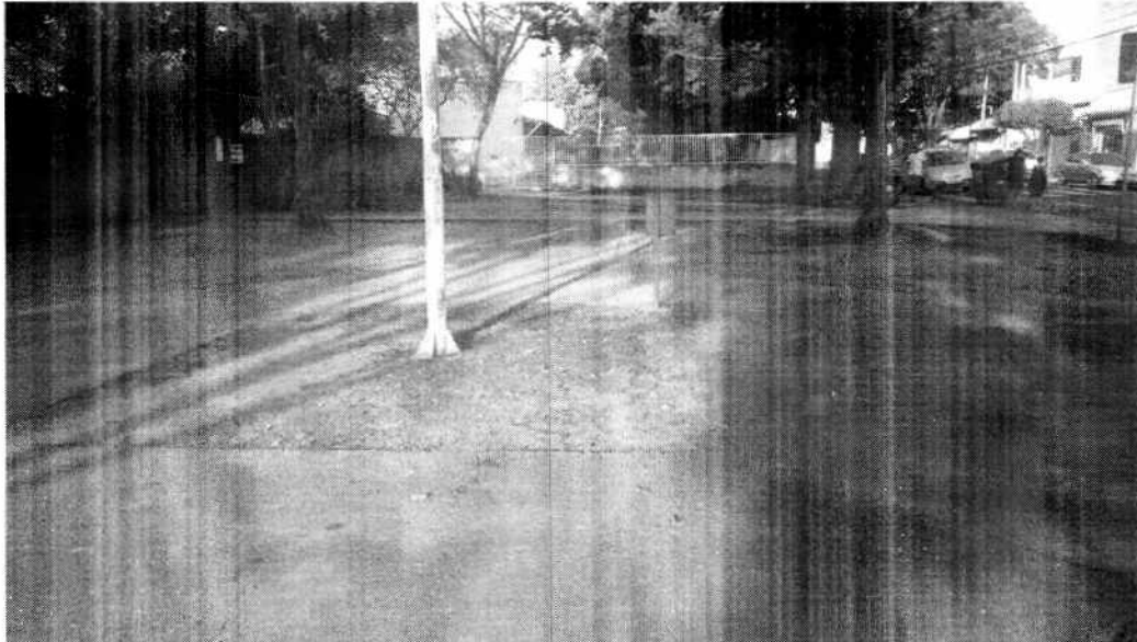
Anexo II - Imagem recebida em 14/05/19