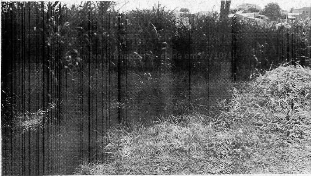
Anexo II - imagem recebida em 22/10/18