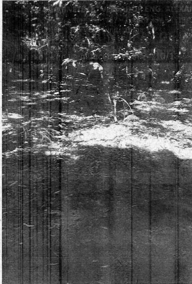
Anexo II - imagem recebida em 22/10/18