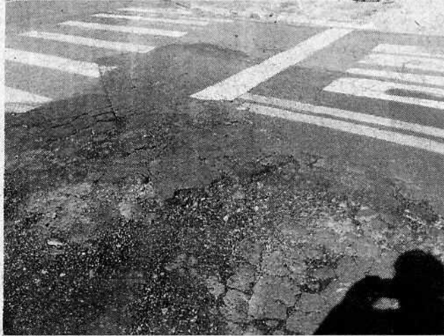
Anexo II (foto tirada em 25/09/18)