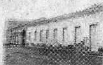
Fundação Pró-Memória de Indaiatuba

Rua Humaitá, 1167 Centro – PABX: (19) 3885-7700. CEP: 13.339-140 – Indaiatuba - SP