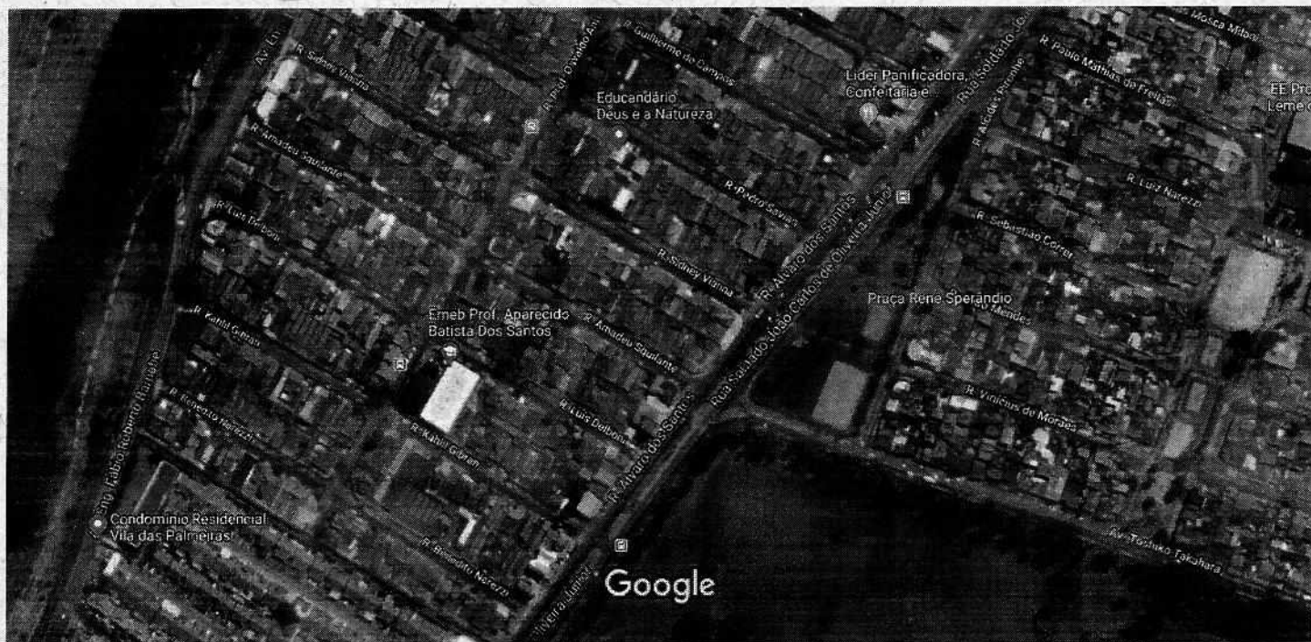
50 m