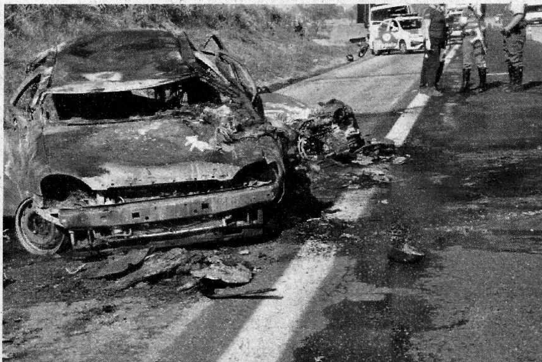
Anexo I - Imagens do acidente