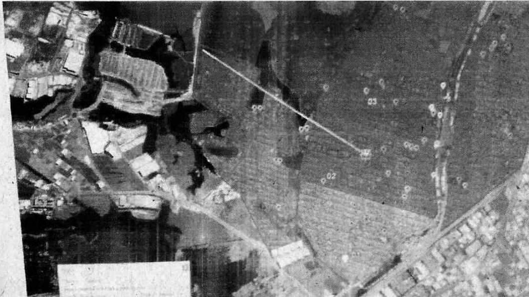
Imagem I - Zona de Abrangência 2 - UBS VII - Distância do Colibris (dois quilômetros)

Justifico que com o crescimento da população no Jardim Colibris e arredores, mais especificamente no Jd. Paulista I e II, Jd. Paulistano e Jardim dos Sabiás, é necessária uma nova Unidade Básica de Saúde (UBS) para atendimento primário do SUS, pois atualmente, naquela Zona de Abrangência 2, temos apenas a UBS VII que atende aproximadamente 5.000 domicílios e mais de 14.000 pessoas 1 . Essa UBS chega a estar a 2 km do ponto mais a norte do Colibris e a mais de 3 quilômetros da rua mais afastada do Jardim dos Sabiás, conforme mapa abaixo.