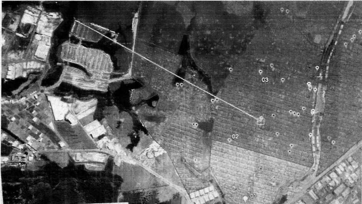
Imagem II - Zona de Abrangência 2 - UBS VII - Distância do Sabiás (três quilômetros)

Por se tratar de um Direito básico da população, o que dá legalidade, legitimidade e relevância à esta Indicação, solicito a compreensão de V. Exsa. para viabilizá-la o mais urgentemente possível.