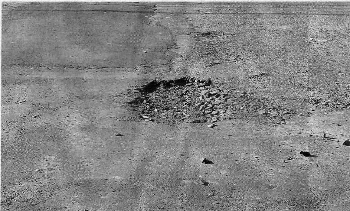
Anexo II - Foto tirada em 16/07/18