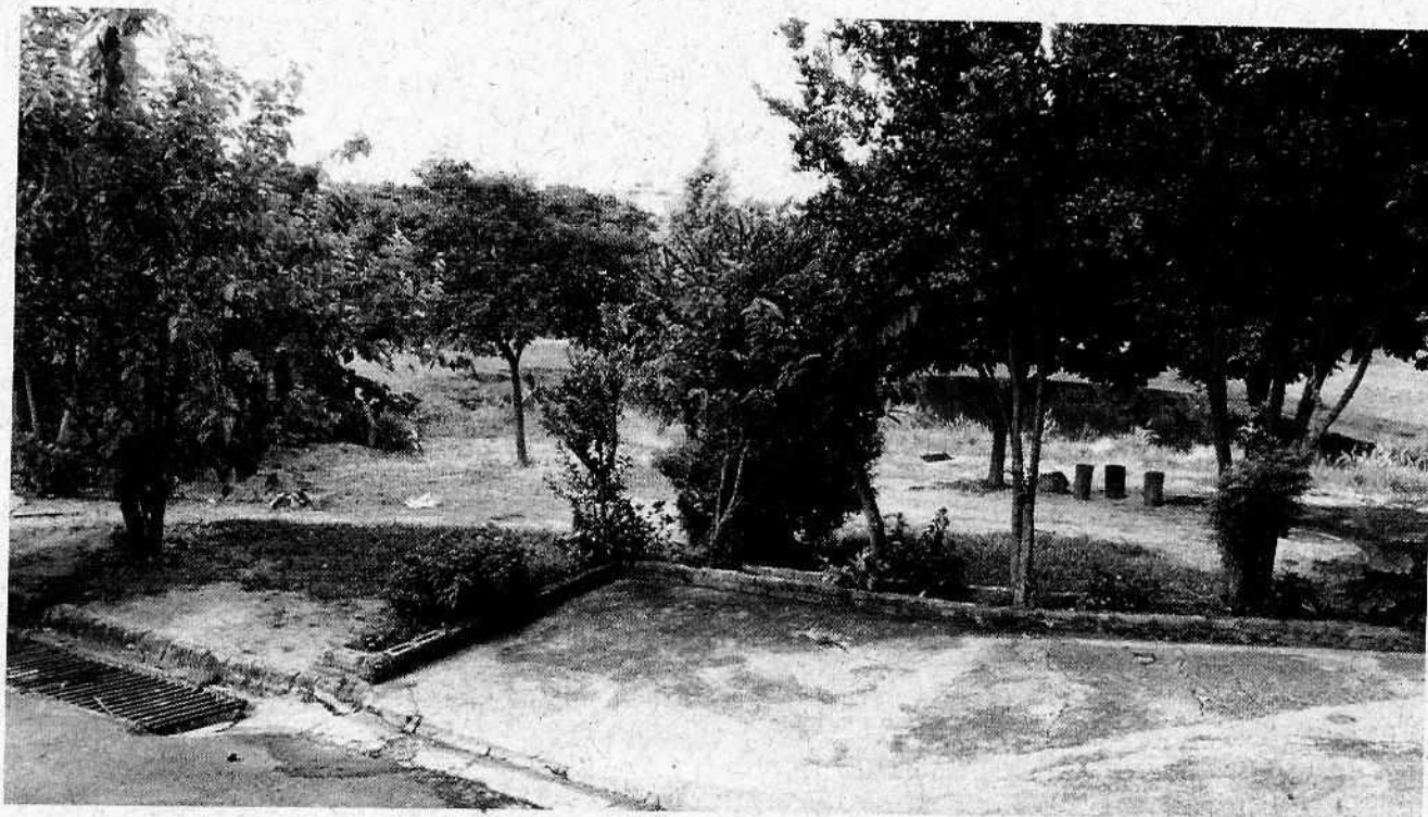
Rua sem Tubo de Concreto para impedir acesso de veículos