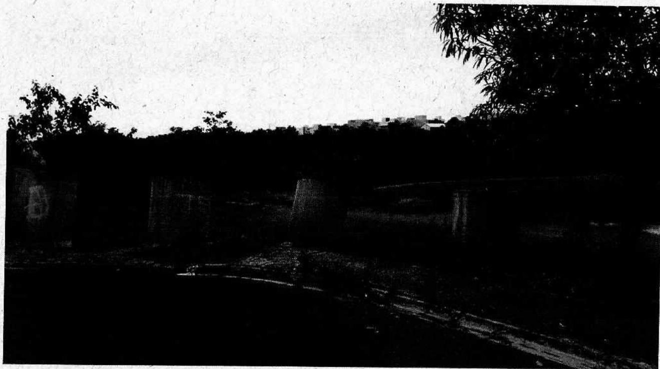
Rua detrás com Tubos de Concreto