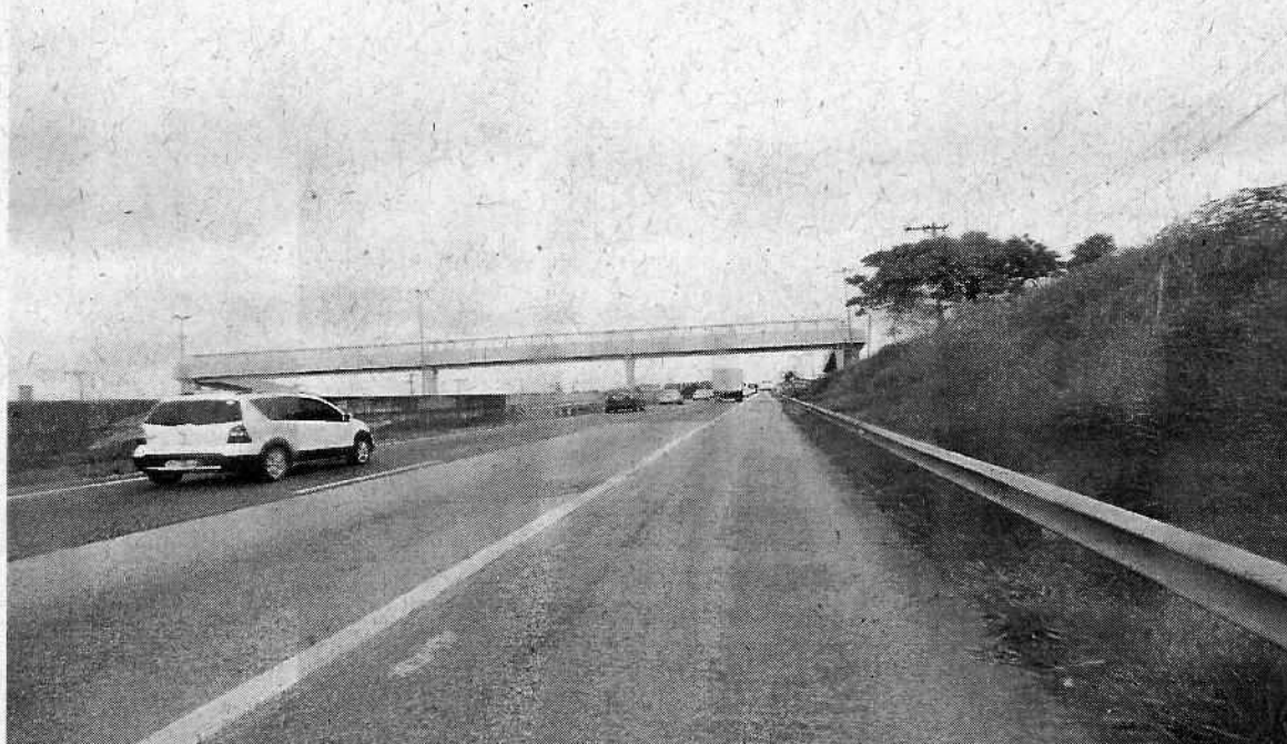
Anexo II - Foto tirada em 09/03/18