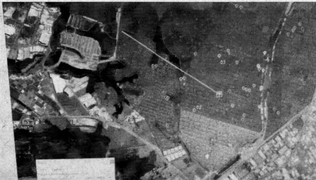
Imagem I - Zona de Abrangência 2 - UBS VII - Distância do Colibris (dois quilômetros)

Justifico que com o crescimento da população no Jardim Colibris e arredores, mais especificamente no Jd. Paulista I e II, Jd. Paulistano e Jardim dos Sabiás, é necessária uma nova Unidade Básica de Saúde (UBS) para atendimento primário do SUS, pois atualmente, naquela Zona de Abrangência 2, temos apenas a UBS VII que atende aproximadamente 5.000 domicílios e mais de 14.000 pessoas 1 . Essa UBS chega a estar a 2 km do ponto mais a norte do Colibris e a mais de 3 quilômetros da rua mais afastada do Jardim dos Sabiás, conforme mapa abaixo.