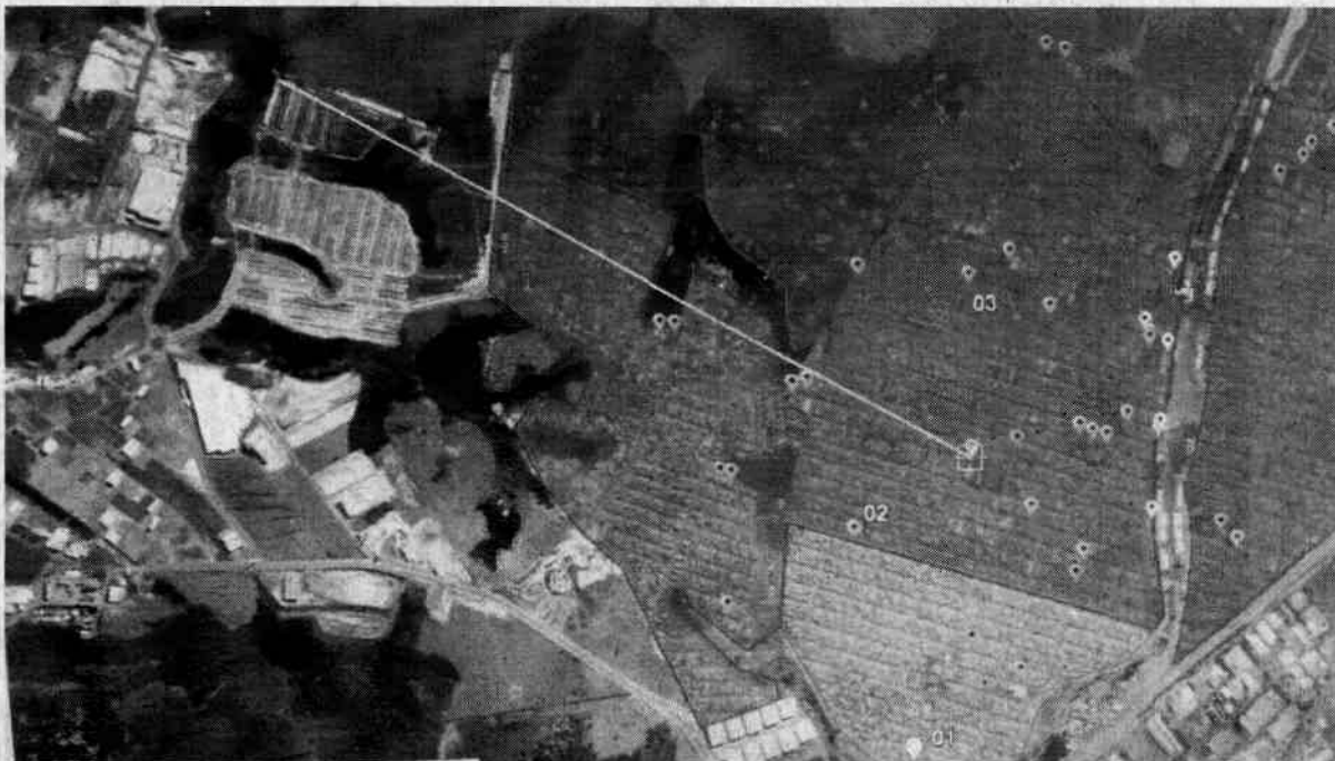
Imagem II - Zona de Abrangência 2 - UBS VII - Distância do Sabiás (três quilômetros)

Por se tratar de um Direito básico da população, o que dá legalidade, legitimidade e relevância à esta Indicação, solicito a compreensão de V. Exsa. para viabilizá-la o mais urgentemente possível.