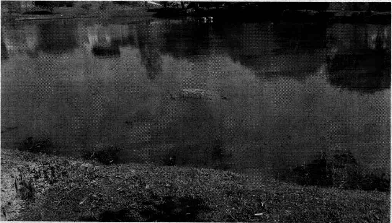
Anexo III - foto recebida em 09/08/17