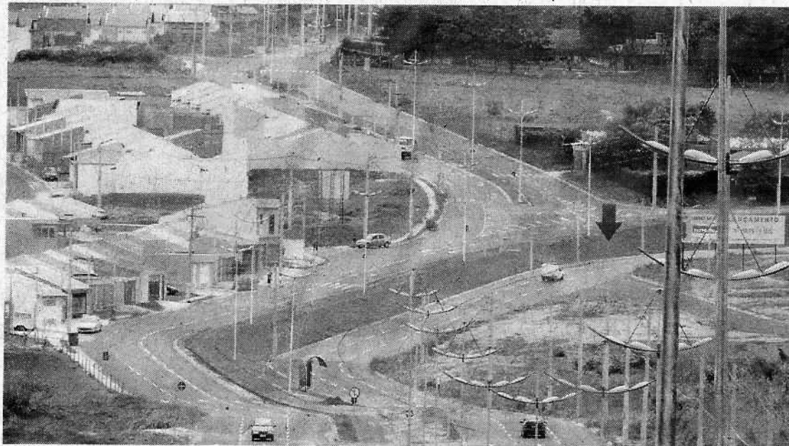
Anexo II (foto tirada em 08/11/17)