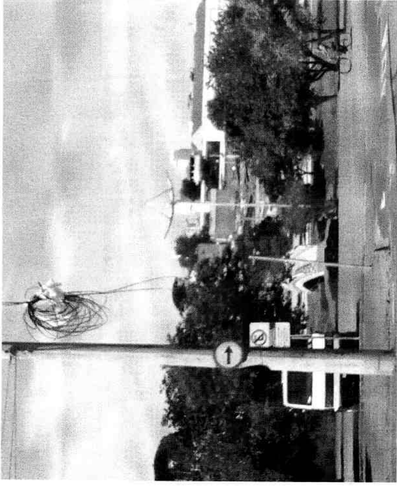
Figura 2 ( No Jd. Hubert não tem Semáforo para Pedestres )