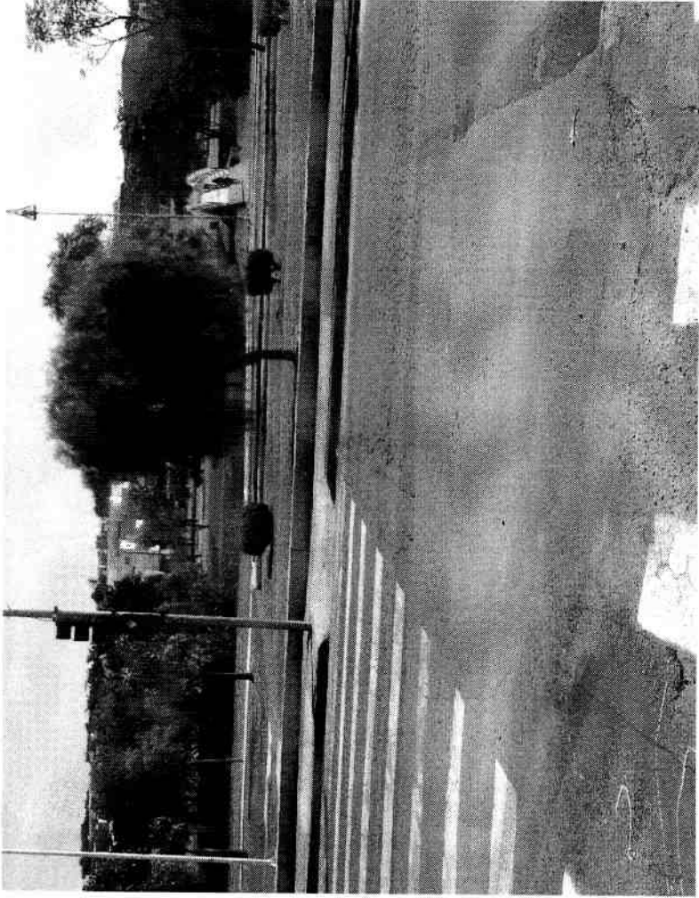
Figura 1 ( No Jd. Tancredo Neves tem Semáforo para Pedestres Instalado )