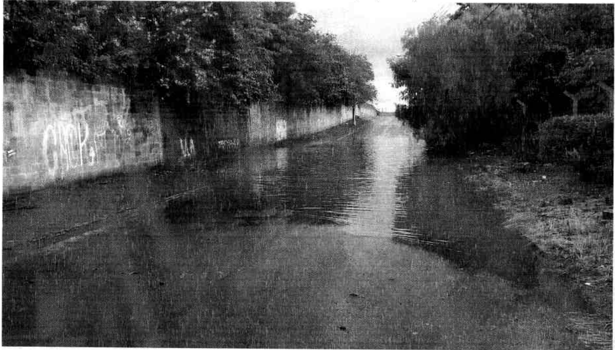
Anexo II (foto tirada em 07/04/17).