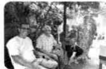
Jd Morada do Sol completa 37 anos