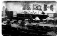
Segunda sessão ordinária do ano aprova oito projetos e um veto