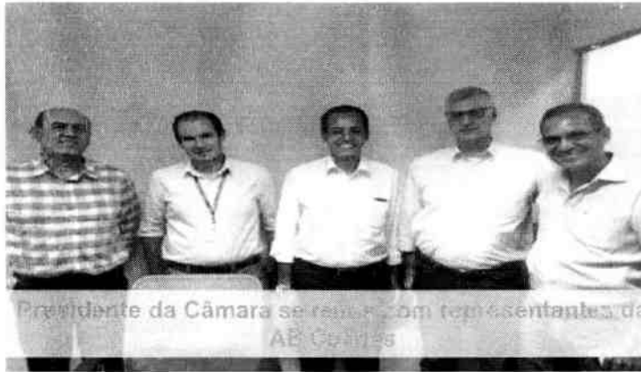
Presidente da Câmara se reúne com representantes da AB Games