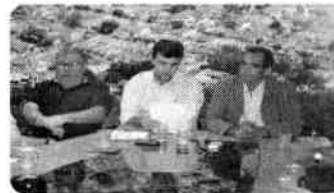
Vereadores pedem veto ao artigo 1º do PL que dispõe sobre subsídios de agentes políticos