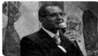
Hélio Ribeiro assume a presidência do Parlamento Metropolitano