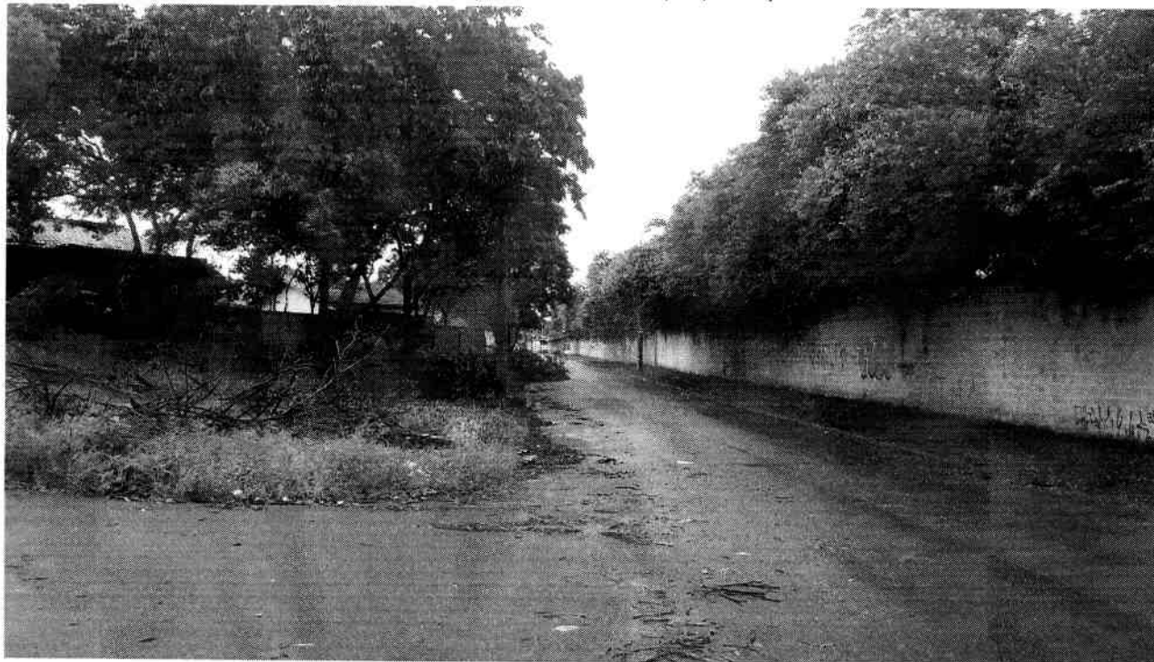
Anexo II (foto tirada em 07/04/17).