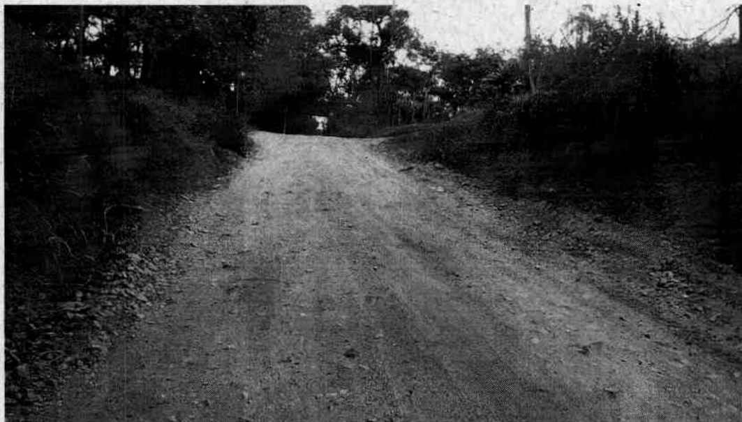
Active/declive acentuado, com pedras que potencializam a situação escorregadia.