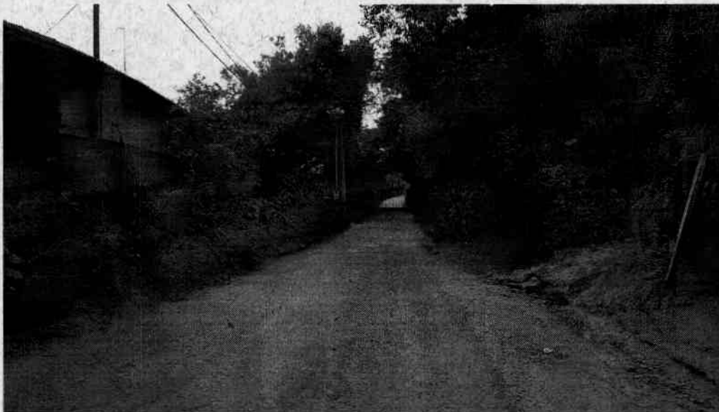
Problema com a vegetação - parte da alameda é invadida.