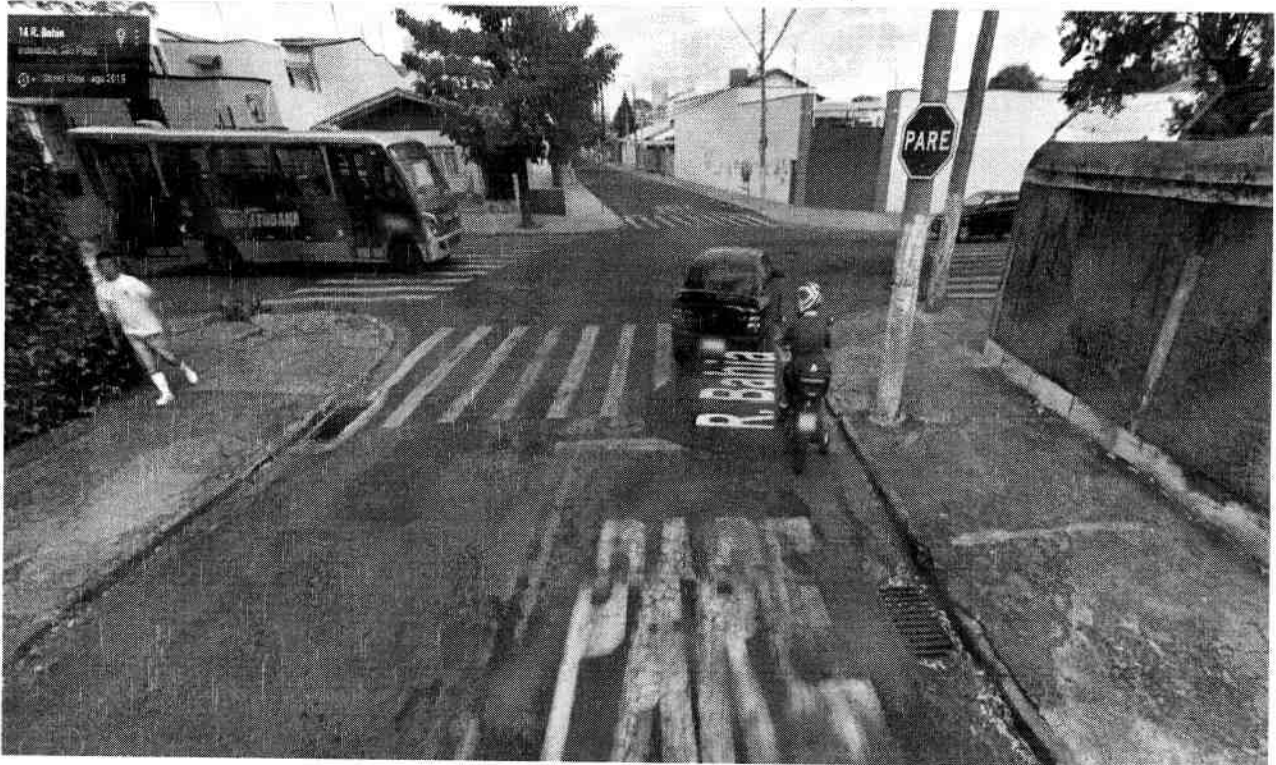
Anexo II (foto recebida em 27/03/17).