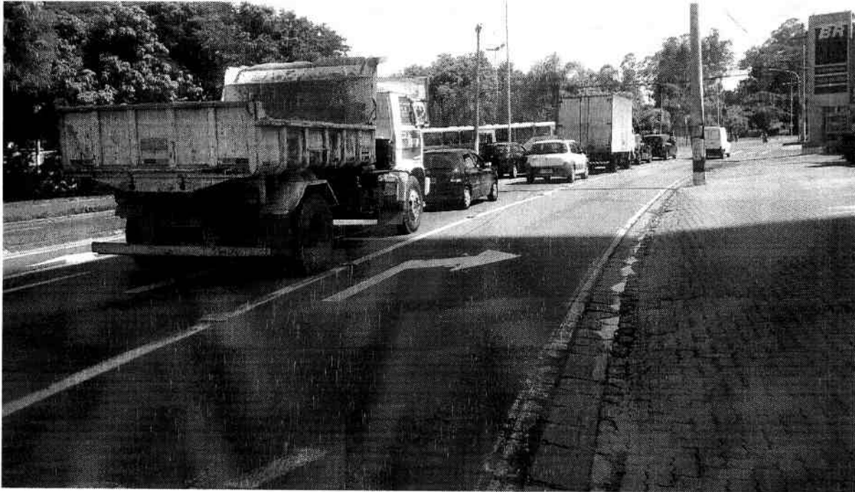
Anexo IV ( foto tirada em 30/01/2017)